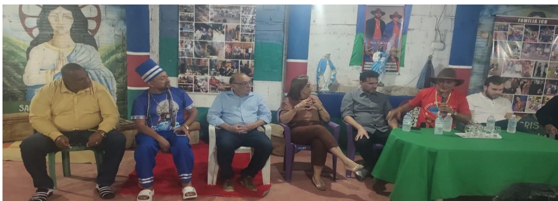
Imagem 7: Visita a associação quilombola no patriarca.