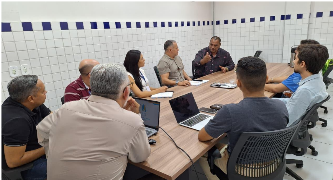
Imagem 02. Reunião na EduForma dando continuidade no planejamento das metas do projeto EJA, medição e controle – 21/01/2026.