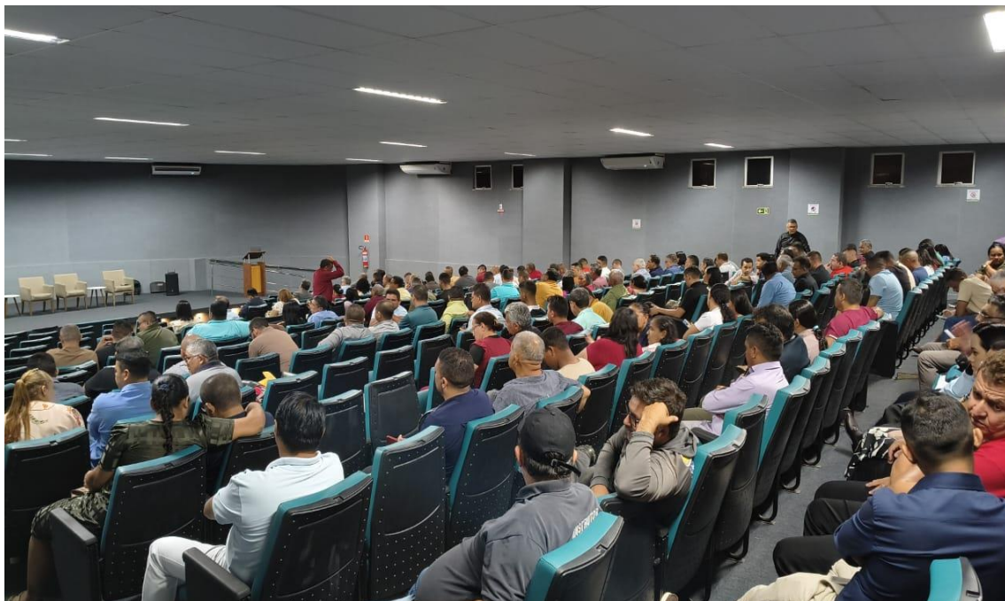
Imagem 04. Reunião com agentes educacionais comunitários, dando continuidade no planejamento e treinamento junto com os agentes

Imagem 03. Reunião com agentes educacionais comunitários, dando continuidade no planejamento e treinamento junto com os agentes