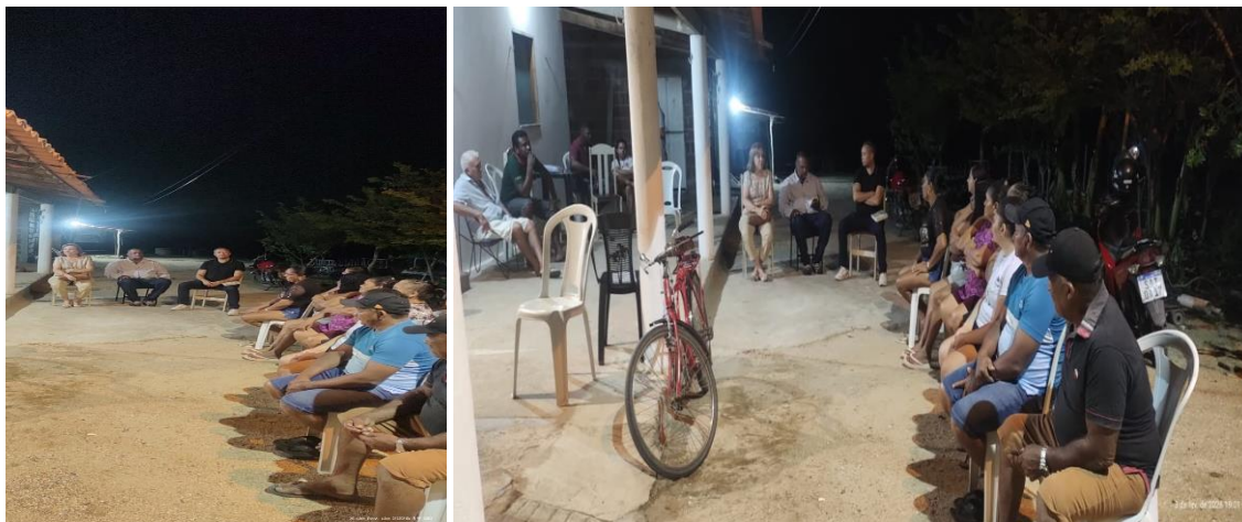
Imagens 5 e 6: Visita a associação quilombola no patriarca.

Obs4: Seguem alguns registros da apresentação do Projeto Sobral Educa para lideranças comunitárias e demais entidades sociais: