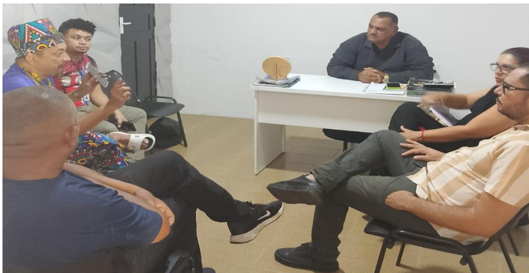
Imagem 01. Reunião definição de estratégias na Degraus com Lideranças – 14/01/2026

Obs1: Seguem alguns registros das reuniões de planejamento realizadas ao longo do mês de janeiro/2026: